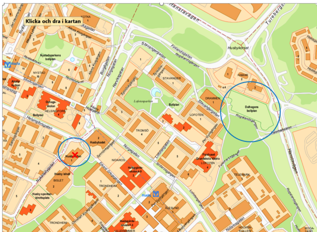
I denna kartbild är Husbyhallen samt Dalhagens BP inringade (dpMap).