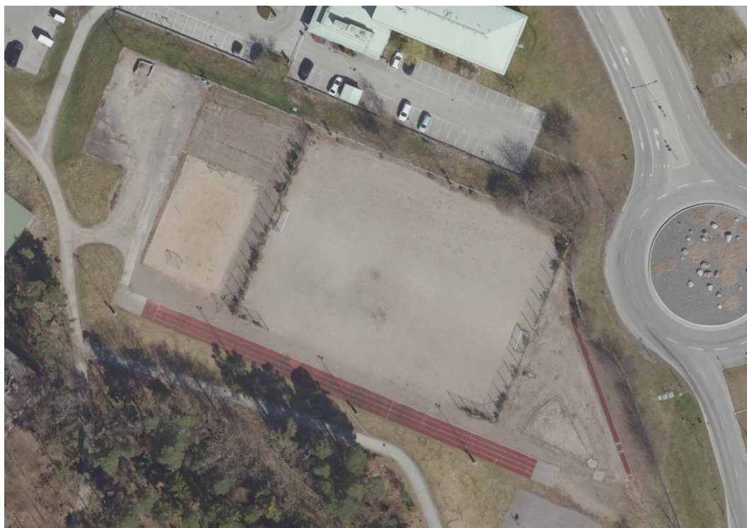
Situationsplan över den befintliga anläggningen – Dalhagens BP.

Avsikten är att hallen ska uppföras för att fungera främst för föreningslivet, med fokus på de traditionella inomhusidrotterna, samt för skolidrotten.